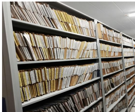
FD Registro Publico