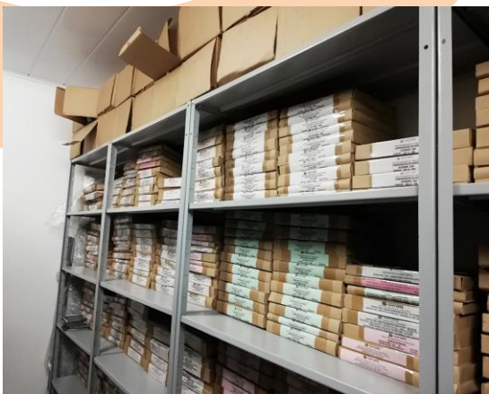
Fondo Documental otras áreas