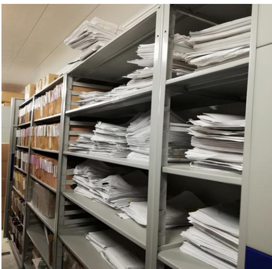
Documentos por actualizar RP